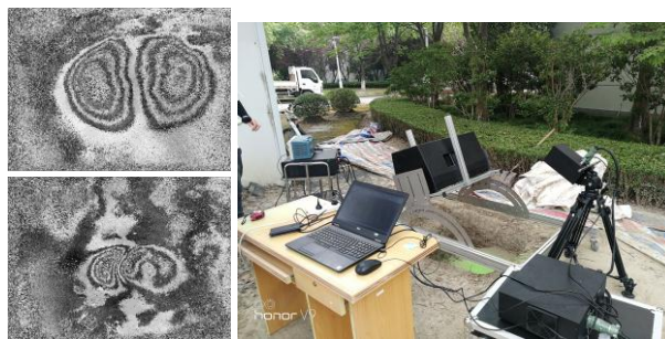
地雷声光融合成像