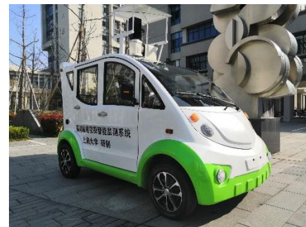
车载微光夜视监测系统